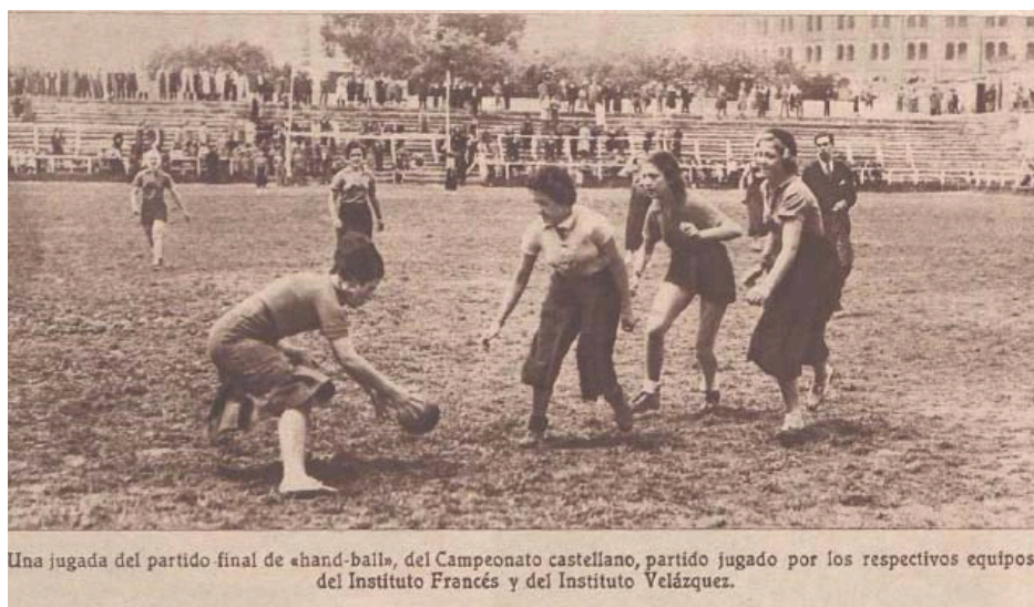
[Ilustración 4: “Campeonato Universitario Femenino de hand-ball”, Crónica , 19/05/1935, p. 12]

El éxito del campeonato universitario y la excelente organización del deporte escolar madrileño llevó a la organización del primer “Campeonato de Castilla de Hand-ball” (Fernández, 1936). Hacia mayo de 1935 ya se había constituido la Federación Castellana de Hand-ball, principalmente destinada a la organización de los campeonatos femeninos, pero también decidida a iniciar la expansión hacia la población masculina, empezando por la escolar. Inmediatamente después de finalizar el Campeonato Universitario, en junio de 1935, se organizó en el campo de “El Parral” un campeonato femenino de Castilla con la presencia de nuevos equipos como el Madrid FC, el Español, el Nacional, las Legionarias de la Salud y la Sociedad Gimnástica Española. Esta competición fue ganada por el equipo Nacional ( La Libertad , 27 y 28/06/1935, p. 10).