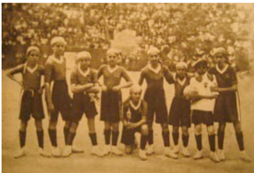
[Ilustración 1: Equipo infantil de Melilla ganador de Campeonato de hand-ball . La Vanguardia-Notas Gráficas , 02/05/1930, p. 3.]

Los Exploradores de España organizaron desde su fundación numerosos concursos y festivales gimnástico-deportivos. Entre sus deportes favoritos estaban el boxeo y el fútbol, aunque también se pusieron en práctica numerosos juegos del tratado del capitán Baden Powell (1914), entre los que se encontraban algunos con balón. Por eso no debería parecer excepcional que dicha asociación también se iniciara, desde principios de los años veinte al juego de “Balón a la mano” de Jentzer, aspecto que podría relacionarse con la introducción del juego en algunos de sus conocidos campeonatos deportivos. Como prueba aportamos la noticia que en 1930 el equipo de Exploradores de Melilla conquistó en hand-ball la Copa de oro de los Exploradores de España. Esta noticia fue presentada en La Vanguardia Notas Gráficas con la incorporación de la foto del equipo vencedor del campeonato (2/05/1930, p. 3).