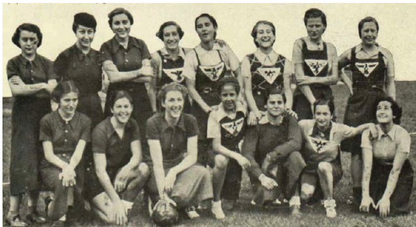
[Ilustración 5: Los equipos femeninos de Hand-ball del Club Femenino de Deportes y de la F. U. E. Deportiva que celebraron un interesante partido el domingo 22 de marzo de 1936. Aviación y deportes , núm. 3 p. 33]