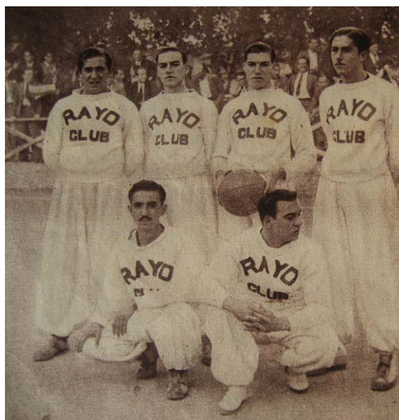
Ilustración 4: Equipo Rayo Club vencedor de la temporada 1933/34.

En 1935 el baloncesto madrileño había logrado superar una difícil primera fase de aclimatación y gozaba de muy buena salud. Existían tres divisiones y competiciones de equipos Juniors e Infantiles. El interés deportivo prácticamente se concentraba en torno al Campeonato Castellano y por la supremacía del Rayo Club (Fred, 1935a y 1935b). [Ilustración 4] A pesar del rápido desarrollo que emprendió el baloncesto a partir de los años treinta, la Sociedad Gimnástica Española reconocía que estaba poco arraigado, aunque “indiscutiblemente el público ha acogido con simpatía e interés; lo que prueba que no tardando mucho, se ha de generalizar este deporte” (Pochi-Negrilo, 1935, p. 28).