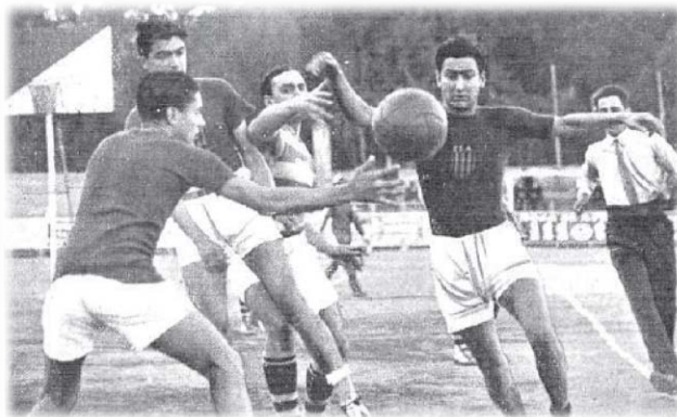
Ilustración 3: Un momento del partido de baloncesto entre el Hindú Club de Buenos Aires y la Selección catalana.

Como anotan Olivera y Tico (1993), en España hasta 1927 aún participaban siete deportistas en el juego y en un espacio de grandes dimensiones. Ello marcó un conflicto, puesto que la presencia en Barcelona en 1927 del Hindú Club de Argentina, que estaba de gira por Europa, condicionó el partido contra la selección catalana a cinco jugadores tal y como sucedía internacionalmente. [Ilustración 3] A partir de la fecha, los equipos españoles y el reglamento de Federación tuvieron que adaptarse a la normativa internacional (Bucheli, 1938; Calatayud, 2003; Espín, Fernández, González, Roca, y Gallén, 1985c; Olivera y Tico, 1993).