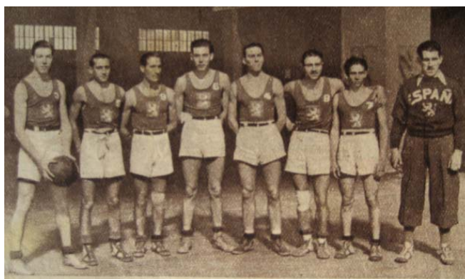
Ilustración 7: Selección española subcampeona de Europa [Fuente autores: Campeón , 12 de mayo, 1935, p. 28]