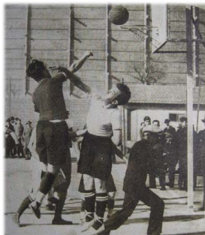
Ilustración 2: 1923. Partido de baloncesto entre el Barcelona y Laietà.