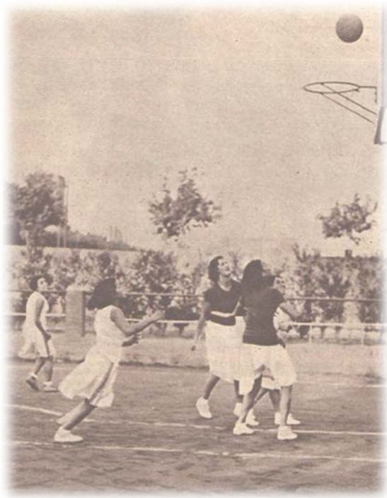
Ilustración 8: Un momento del partido jugado por los equipos del Layeta FC y el Barcelona FC. [Fuente BNE: Crónica , 28 de octubre de 1934, p. 38].

Cabrera (1934), ante la emergencia del baloncesto femenino, incorporó en la revista Campeón las diferencias técnicas y reglamentarias entre el juego femenino y masculino: “los equipos se improvisan sin el menor conocimiento de los reglamentos ni de sus innovaciones, especialmente en lo que concierne al juego femenino, del que todavía no ha editado el correspondiente reglamento la Confederación Española” (p. 30). Una de las diferencias técnicas más características fue la supresión del dribling o botes sucesivos. Solamente se permitía un bote con una o ambas manos, además de prohibir la retención del balón más de tres segundos. Con estas normas, las combinaciones del juego eran más espectaculares y se disminuía el “riesgo de las violencias inherentes al juego masculino” (Cabrera, 1934, p. 30).