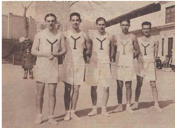
Ilustración 5: Equipo de baloncesto de la Academia de Infantería de Toledo.

En el estamento militar el baloncesto estaba promocionado por el Inspector General Ángel García del Barrio. En la temporada 1932/33 participaron en el Campeonato la Escuela Central de Gimnasia [Ilustración 5], la Escuela Aeronáutica Naval y la Segunda Comandancia de Infantería (Ollé, 1933). El 15 de abril de 1935, en el estadio de Chamartín, con motivo del partido internacional entre España y Portugal se disputó un encuentro entre las selecciones militares de Cataluña y Castilla, con triunfo de los primeros (Fred, 1935c).