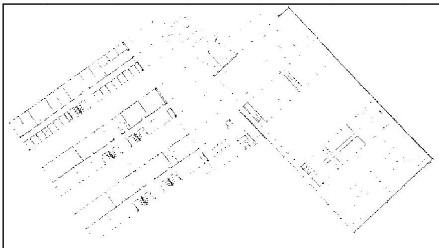
Figura 3. Mapa de orientación de la Facultad de Ciencias del Deporte (Cáceres).

Descripción: Un componente de la pareja se tumba en el suelo en decúbito supino, relajado sobre la esterilla. El compañero le cogerá primero los brazos y luego las piernas, realizando movimientos secos y cortos de estas extremidades durante un intervalo de tiempo. Tras un periodo de tiempo habrá cambio de roles.