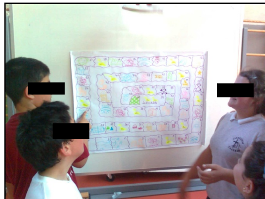
Figura 2. Tablero del juego de la oca

Descripción: Se delimitan dos campos de juego similares al del beisbol tradicional en el que jugarán dos equipos. Se aplican las reglas similares al beisbol partiendo de que el pitcher lanzará el balón con el pie y a ras de suelo, de este modo el bateador golpeará con el pie tan lejos como pueda. En este caso los jugadores del pitcher intentarán volver la pelota a este lo más rápido posible mientras el bateador corre de una base a otra intentando llegar al “home” (zona donde se batea). El equipo que anote más carreras al cabo del de los nueve episodios, llamados “innings” que dura el encuentro es el que resulta ganador. Si el balón se coge al vuelo hay cambio de roles. Del mismo modo si un jugador se encuentra entre dos bases y el pitcher lo “caza”, volverá al home sin eliminarse.